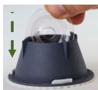
Sätt i doftbetet