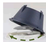
Lossa vid inspektion

Doftbetet innehåller syntetiska feromoner som vid direktkontakt kan orsaka allergiska reaktioner. Läs säkerhetsdatabladet för ytterligare information om dessa. Håll borta från barn och husdjur.