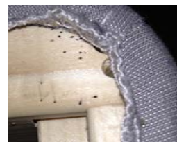
Spår efter vägglöss

Om du hittar vägglöss vid inspektion eller i fällorna kontakta omgående ditt försäkringsbolag och ett professionellt saneringsföretag.