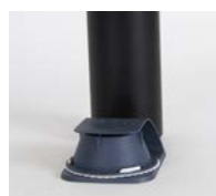
Placera ut fällan